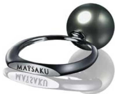
Кольцо из коллекции MAYSAKU : жемчуг Таити 10,5 мм, золото 750°, черный родий.