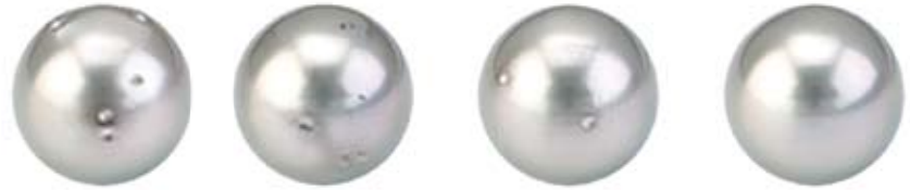
Качество поверхности жемчуга

Форма жемчуга напрямую сказывается на его цене. Жемчужина более правильной сферической формы оценивается дороже. Легкая неправильность, когда жемчуг удлинен или приплюснут на полюсах, существенно снижает его ценность. Различают три основные формы жемчужин: сферическую, симметричную и барочную. Жемчуг сферической формы встречается в природе реже всего, оттого он и стоит дороже. Симметричный