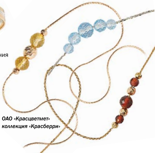
ОАО «Красцветмет» коллекция «Красберри»