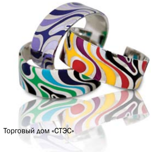
Торговый дом «СТЭС»

Новые партнеры означают серьезное обновление вашего ассортимента. Расскажите, какие новые предложения у вас появились для покупателей?