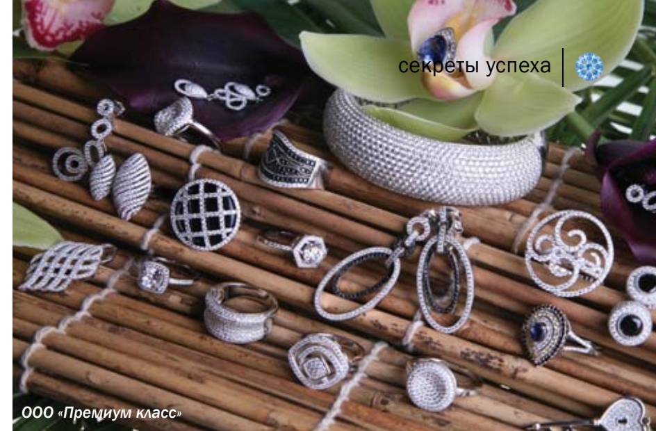
ООО «Премиум класс»

Самая актуальная тенденция современной ювелирной моды – это объемные и массивные золотые украшения. Очевидно, что в полном объеме такие изделия не всем доступны. Поэтому, адаптируясь к условиям рынка и осваивая новые технологии, многие отечественные производители выпустили изумительные по красоте пустотелые аналоги. Лидеры ювелирной отрасли – завод «Красцветмет» и завод «Адамант», компания «Ювелиры Северной столицы» – производят эффектные пустотелые цепи из золота, которые мы с радостью предлагаем