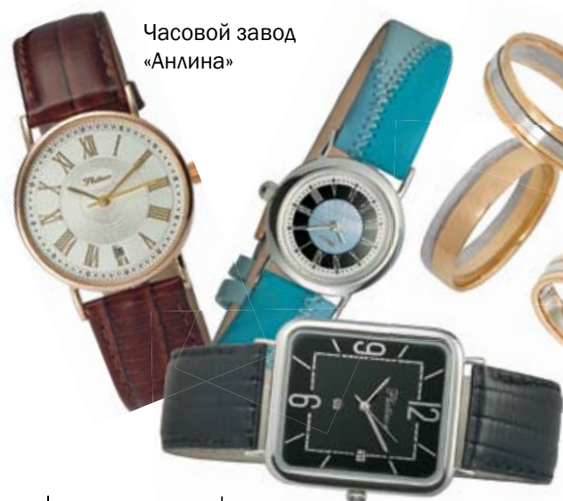
Часовой завод «Анлина»

в апреле компания «Ювелир-опт» получила статус официального дилера ювелирного завода «Красцветмет». Для нас это не только большое событие и почетная миссия, но и серьезные обязательства перед крупнейшим ювелирным заводом – лидером цепевязального производства в России по продвижению его торговой марки в Уральском регионе. Я считаю, эти факты свидетельствуют о том, что «Ювелир-опт» – на верном пути развития.