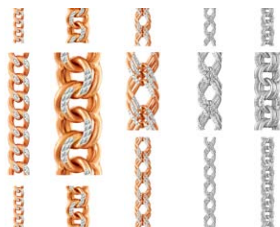
Ювелирный завод «Адамант»

Не секрет, что уже третий год ювелирная отрасль вынуждена работать в неблагоприятных экономических условиях. В связи с этим компания «Ювелир-опт», как ведущий поставщик и представитель крупнейших ювелирных заводов страны в Уральском регионе, ставит своей задачей подготовить клиентам такое предложение, которое качественно расширило бы ассортимент их магазинов и было максимально востребовано у конечных потребителей. Так, новым важным этапом в работе компании стало сотрудничество с ведущим в России производителем пустотелых цепей – заводом «Адамант». Данный контракт является знаковым для нас, поскольку свидетельствует о доверии к нам этого производителя и о серьезной оценке деятельности нашего предприятия. Кроме того,