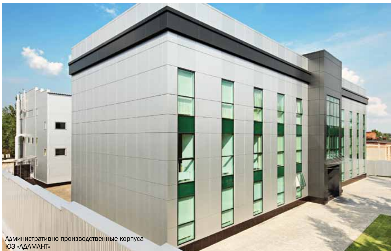
Административно-производственные корпуса ЮЗ «АДАМАНТ»