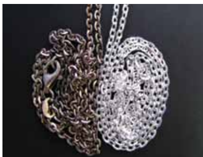
На фотографии представлены якорная цепь ЮЗ «АДАМАНТ» и обычная цепь с одинаковым сроком и условиями хранения в магазине.

ВЫВОД: внешний вид и качество цепи зависят не от пробы (800 или 925), а от технологий, в частности, от финишной обработки. Если есть защитное покрытие – цепь прослужит долго и не потеряет внешнего вида. Если нет – придется раз в пять дней мыть и чистить украшение. Проба же оказывает прямое влияние на стоимость.