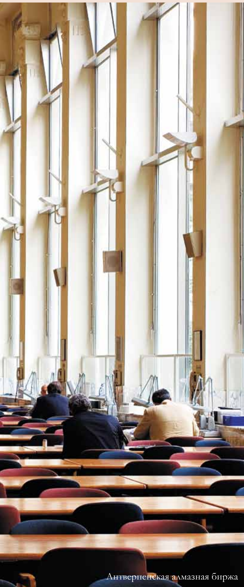
Антверпенская алмазная биржа