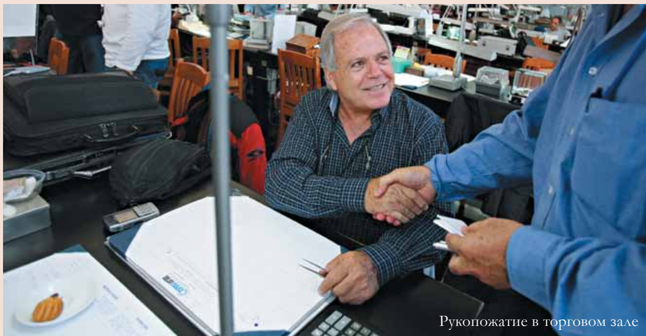
Рукопожатие в торговом зале

слушать и осознать новые идеи, он действовал как катализатор процесса. Нам всем его очень не хватает.