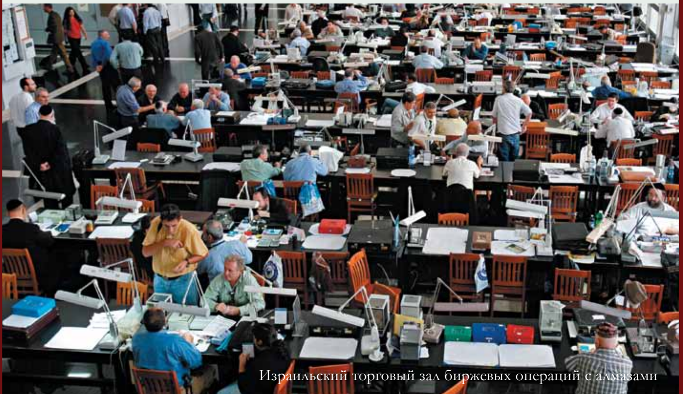
Израильский торговый зал биржевых операций с алмазами

Биржи уже не являются только местом для торговли бриллиантами. Они активно и творчески ищут пути расширения бизнеса и стремятся сделать свои торговые площадки местом для ведения бизнеса.