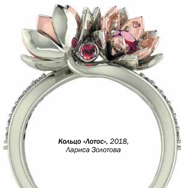
Кольцо «Лотос», 2018, Лариса Золотова