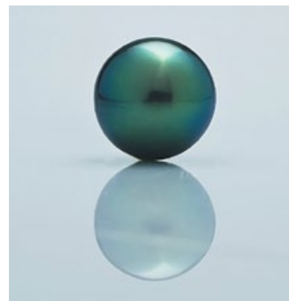
Компания: Orau Pearls Страна/регион: Французская Полинезия Зона: Treasures of Ocean Стенд: 1-A09