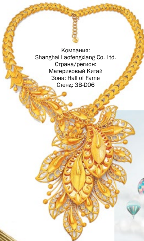
Компания: Shanghai Laofengxiang Co. Ltd. Страна/регион: Материковый Китай Зона: Hall of Fame Стенд: 3B-D06