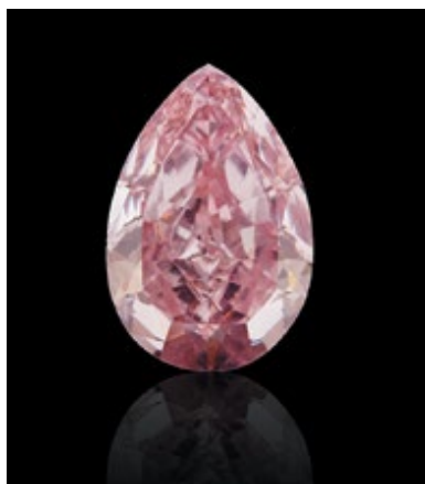
Компания: Novel Collection Ltd Страна/регион: Гонконг Зона: Hall of Fine Diamonds Стенд: 2-Q01