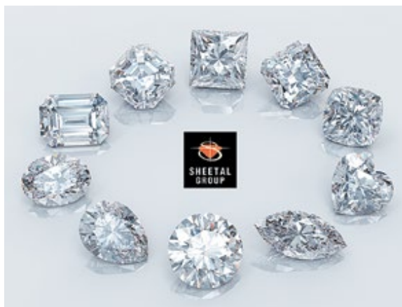
Компания: Sheetal (Far East) Limited Страна/регион: Гонконг Зона: Hall of Fine Diamonds Стенд: 2-R12