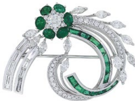
Компания: Oriental Gemco Страна/регион: Гонконг Зона: Hall of Extraordinary Стенд.: 3B-C14