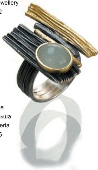
Компания: Glitter & Eva Stone Страна/регион: Польша Зона: Designer Galleria Стенд: 1CON-056