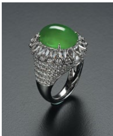
Компания: Jade Garden Страна/регион: Тайвань Зона: Hall of Jade Jewellery Стенд: 1B-B32