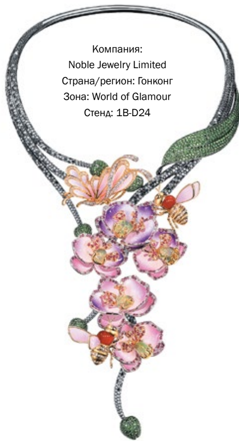
Компания: Noble Jewelry Limited Страна/регион: Гонконг Зона: World of Glamour Стенд: 1B-D24