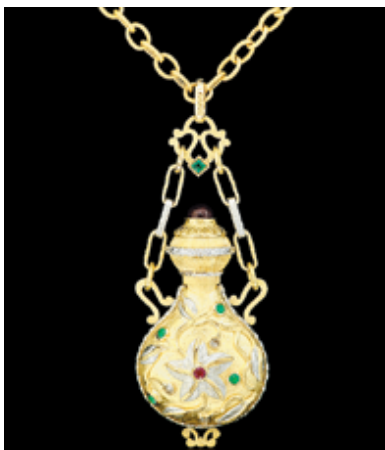
Компания: Dilegend Diamond Manufacturing Страна/регион: Материковый Китай Зона: Antique & Vintage Jewellery Galleria Стенд: CH-K05