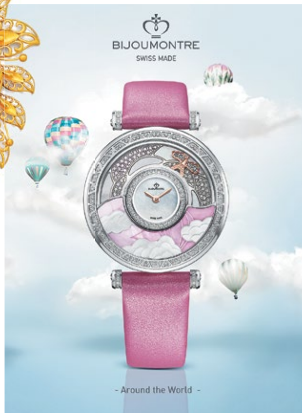
Компания: Bijoumontre (Asia) Limited Страна/регион: Гонконг Зона: Hall of Time Стенд: 3C-E08