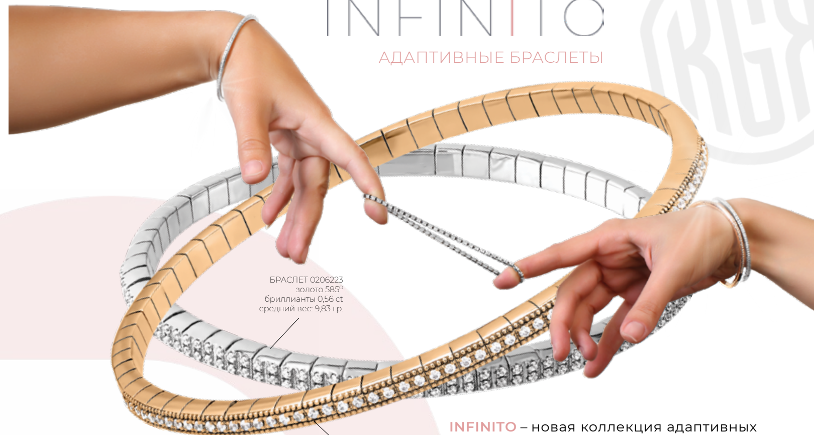
БРАСЛЕТ 0206223 золото 585° бриллианты 0,56 ct средний вес: 9,83 гр.