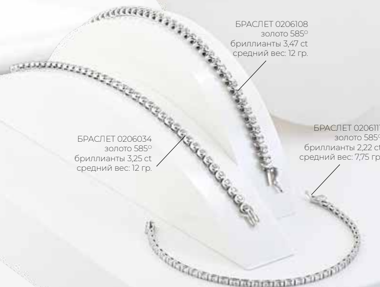
БРАСЛЕТ 0206108 золото 585° бриллианты 3,47 ct средний вес: 12 гр.