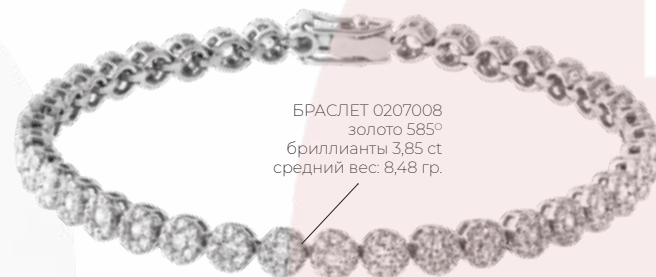
БРАСЛЕТ 0207008 золото 585° бриллианты 3,85 ct средний вес: 8,48 гр.