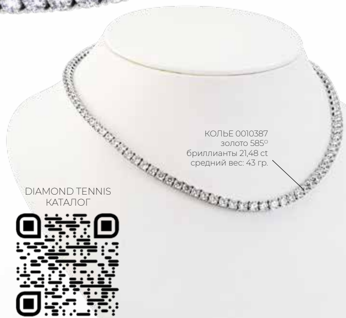
КОЛЬЕ 0010387 золото 585° бриллианты 21,48 ct средний вес: 43 гр.