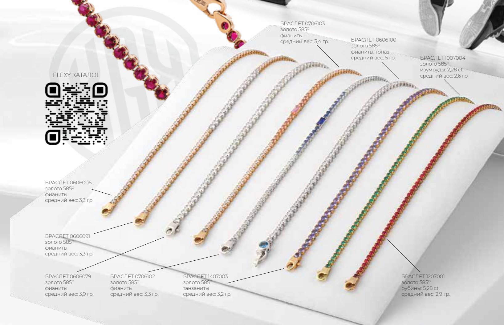
БРАСЛЕТ 1207001 золото 585° рубины: 5,28 ст. средний вес: 2,9 гр.