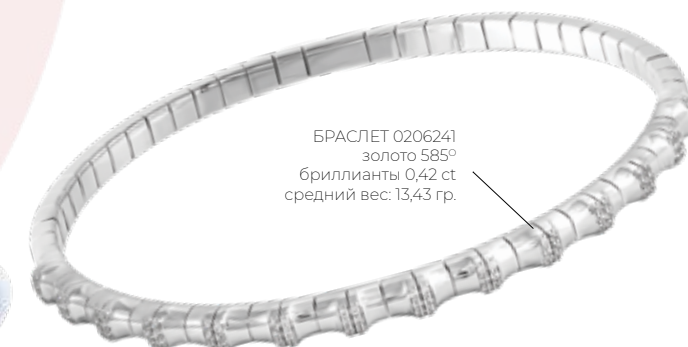
БРАСЛЕТ 0206241 золото 585° бриллианты 0,42 ct средний вес: 13,43 гр.

ООО «ДИЛАЙТ» 195197 г. Санкт-Петербург, ул. Жукова, д. 18 тел.: + 7 (812) 336 63 67 моб.: (whatsapp) + 7 (905) 224 71 56 e-mail: sales@dilight.ru