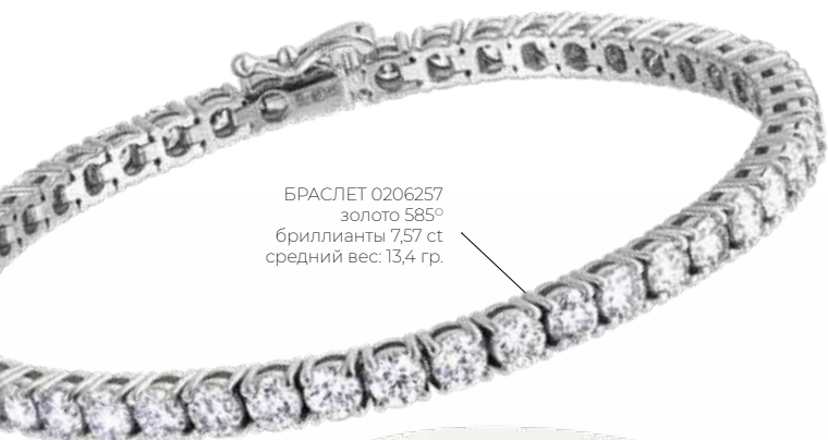
БРАСЛЕТ 0206257 золото 585° бриллианты 7,57 ct средний вес: 13,4 гр.

DIAMOND TENNIS – литые теннисные браслеты из золота и бриллиантов. Ранее модель носила название браслет-дорожка. Но в 1987 году теннисистка Крис Эверт остановила матч, чтобы найти утраченный браслет. Украшение было найдено. Любовь к нему спортсменки не осталась незамеченной. Так у этого ювелирного украшения начался свой путь к славе. Браслет обзавелся более прочным замком и продолжил набирать популярность уже под названием «теннисный». Коллекция дополнена колье.