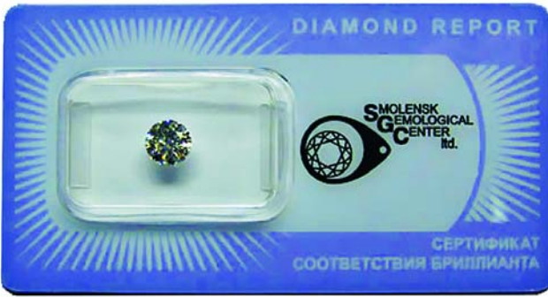
Рисунок 1. Упаковка бриллианта