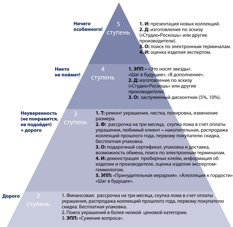
Рисунок. Система сервисной поддержки