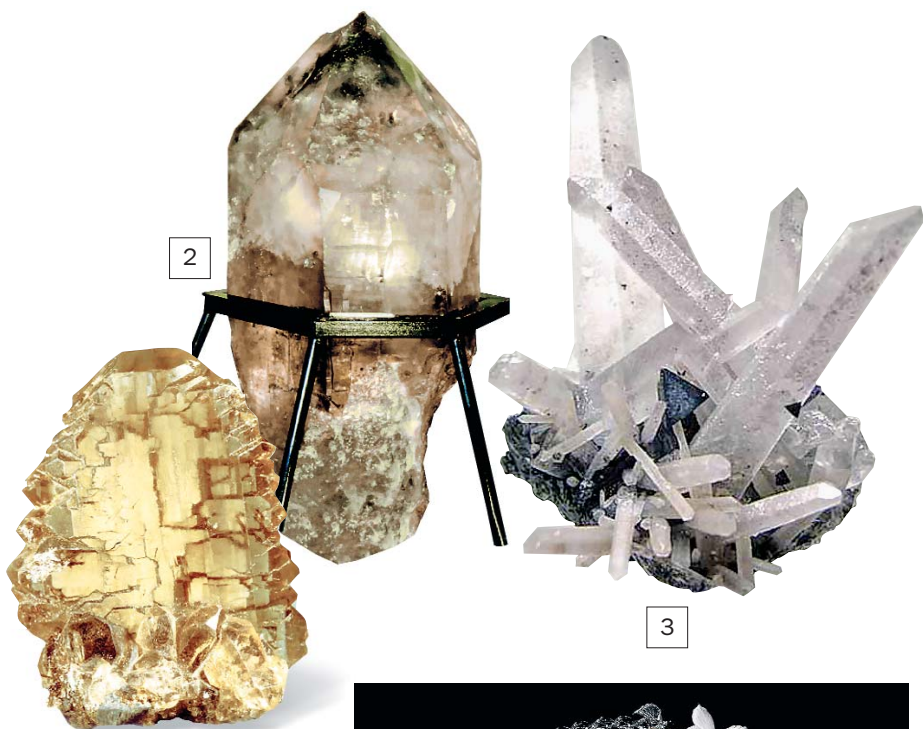
1. Скрученный кварц , 90 мм. Приполярный Урал, месторождение Пуйва.

Искусство резьбы по кварцу достигло расцвета в эпоху Возрождения, когда из кристаллов горного хрустала вырезали фигурки животных, кубки, флаконы и другие