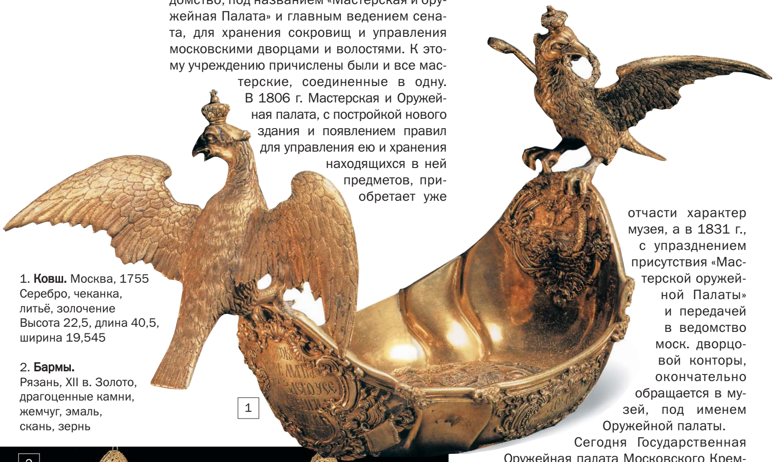
1. Ковш. Москва, 1755 Серебро, чеканка, литьё, золочение Высота 22,5, длина 40,5, ширина 19,545

Петр Великий соединил все старинные приказы дворцового управления в одно ведомство, под названием «Мастерская и оружейная Палата» и главным ведением сената, для хранения сокровищ и управления московскими дворцами и волостями. К этому учреждению причислены были и все мастерские, соединенные в одну. В 1806 г. Мастерская и Оружейная палата, с постройкой нового здания и появлением правил для управления ею и хранения находящихся в ней предметов, приобретает уже