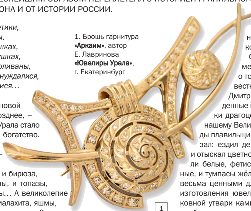
1. Брошь гарнитура «Аркаиим», автор Е. Лавринова «Ювелиры Урала», г. Екатеринбург

Н есомненно, что основой камнерезного и, позднее, – ювелирного искусства Урала стало его минералогическое богатство. Другого слова и не подберёшь, ведь драгоценностей здесь – целая россыпь: это и лазурит, и бирюза, и турмалины, и бериллы, и топазы, и изумруды, и аметисты... А великолепии поделочного камня – малахита, яшмы, мрамора – где ещё такое сыщется?