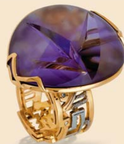
8. Кольцо. Золото, бриллианты, аметрин. «Уральская золотая фабрика», г. Екатеринбург