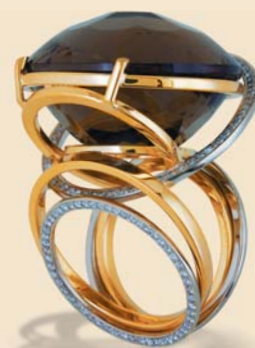
10. Кольцо. Золото, бриллианты, кварц резной. «Уральская золотая фабрика», г. Екатеринбург