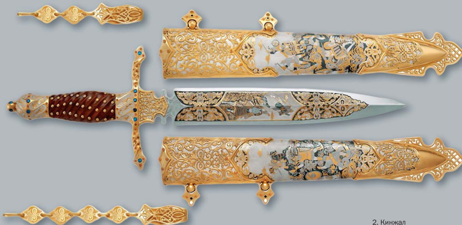
2. Кинжал «Великая битва». ООО «Грифон», г. Златоуст