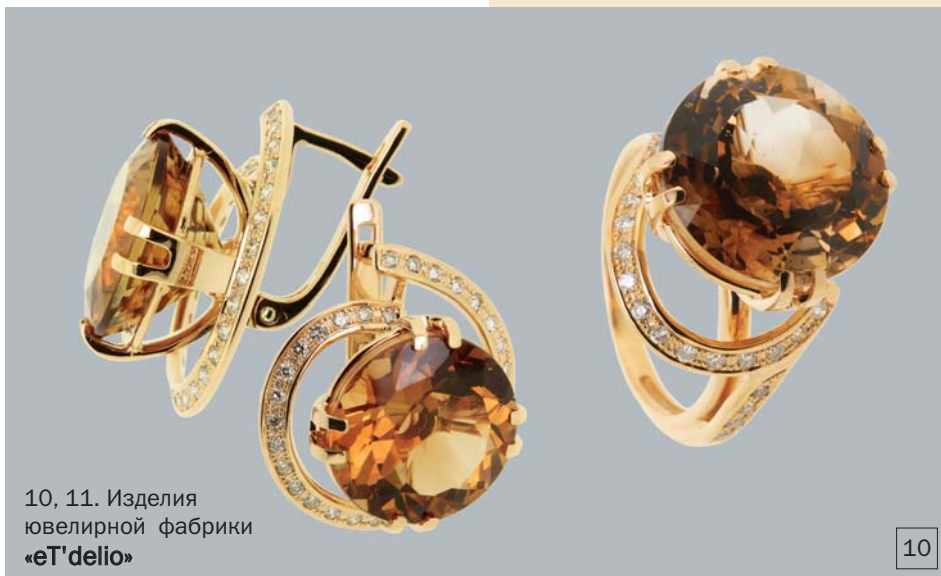
10, 11. Изделия ювелирной фабрики «eT'delio»