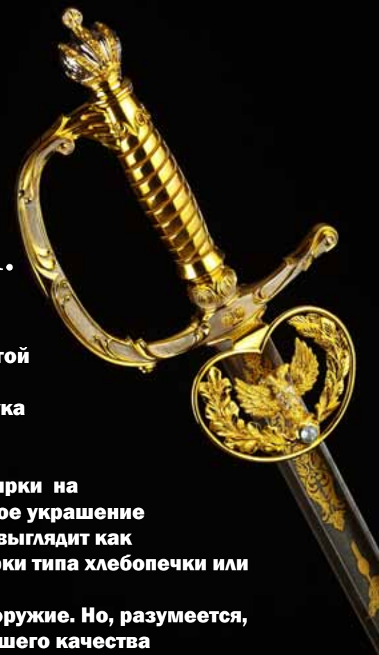
Шпага церемониальная «Высший Чин»