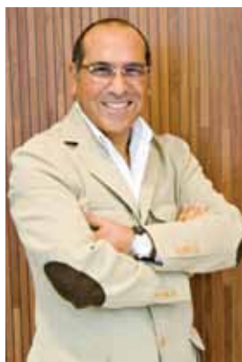
Клаудио СТАБИЛЕ, архитектор

В Европе и США эти вопросы давно решены: покупатели с удовольствием посещают концептуальные магазины. И с не меньшим удовольствием оставляют там кровно заработанные... В России опыт создания концептуальных магазинов не столь широк, но уже имеется. Об особенностях концептуальных магазинов мы беседуем с Клаудио СТАБИЛЕ – известным итальянским архитектором, дизайнером интерьеров.