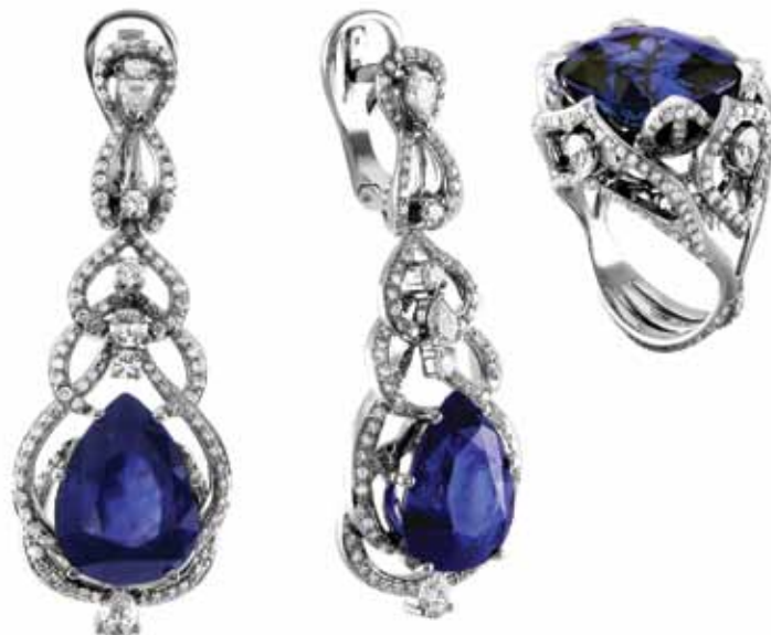
На фото – изделия из новых коллекций компаний «МАДДЕ», «СБ Золото», Carat.