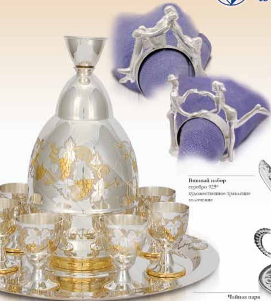
Винный набор серебро 925 0 художественное травление золочение