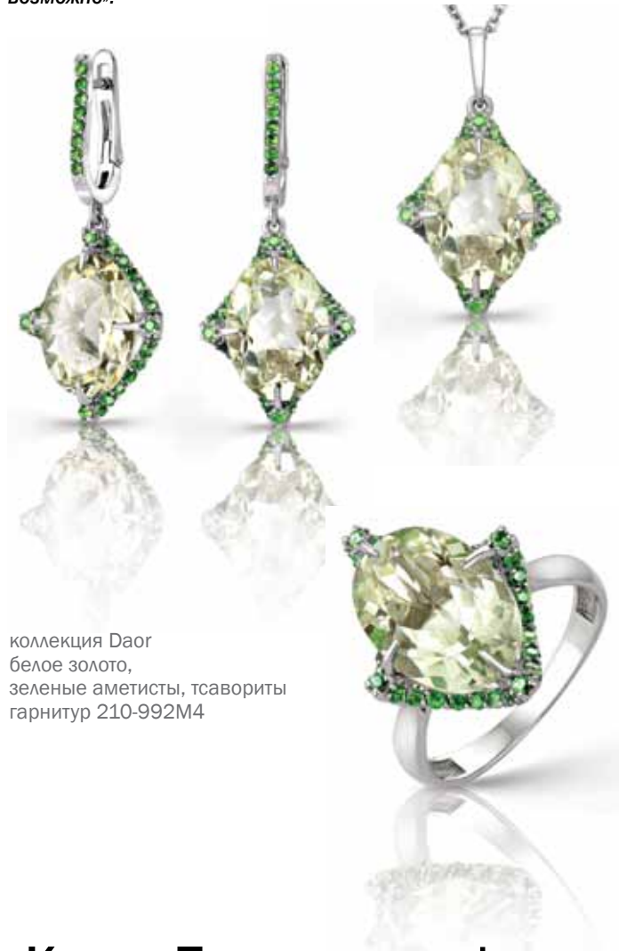
коллекция Daor белое золото, зеленые аметисты, тсавориты гарнитур 210-992M4

Daor – коллекция с цветными сапфирами и новыми цветовыми сочетаниям драгоценных камней.