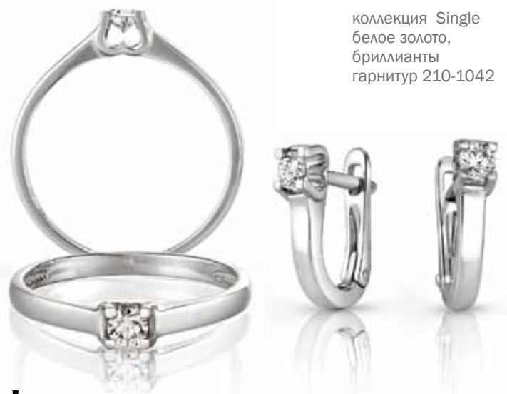
коллекция Single белое золото, бриллианты гарнитур 210-1042

«Карат Платинум» в феврале! 6–10 февраля, Ленэкспо, стенд 143, павильон 8