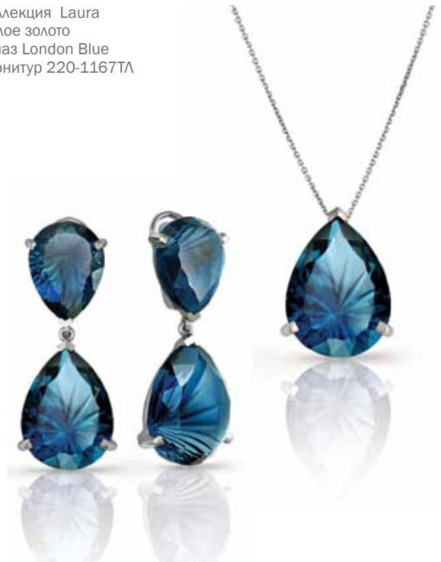
коллекция Laura белое золото топаз London Blue гарнитур 220-11677Л

Новые модели и цветовые вариации коллекции Royal mix будут представлены на февральской выставке Junwex Петербург. Также к выставке приурочена презентация трех новых коллекций фабрики.