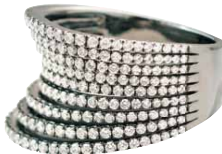
Бриллиантовое кольцо «Zaha» в оправе из 18-каратного золота

“Я хотела создать бизнес, в котором могла бы поддержать производителей, дать им возможность увеличить прибыль и шанс развиваться.