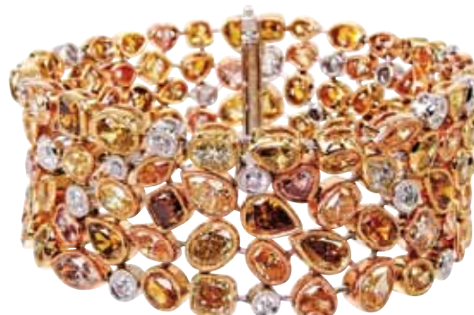
Браслет «Mineva» с желтыми фантазийными бриллиантами

“Мы произвели многочисленные изменения, двигаясь вперед и держась по ветру. Наша основная концепция никогда не менялась, но в зависимости от того, чего хотят покупатели, мы осуществляем изменения на сайте”