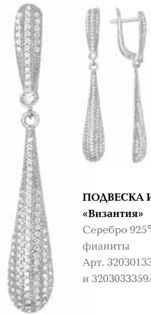
ПОДВЕСКА И СЕРЬГИ «Византия» Серебро 925° фианиты Арт. 3203013359л и 3203033359л

юшим названием — «Звездная россыпь». Загадочный бриллиантовый блеск каждой грани прозрачных как слеза фианитов окружит владелицу украшения драгоценным шлейфом. Словно звездная плеяда спустилась с ночного небосклона, чтобы стать украшением «Алмаз-Холдинг».