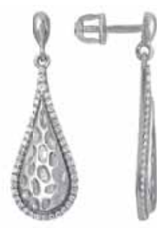
ПОДВЕСКА И СЕРЬГИ «Византия» Серебро 925° фианиты Арт. 3207015458л и 3207033458л