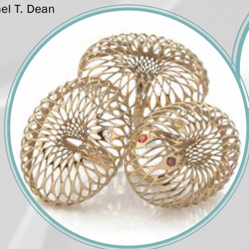
'Orbis' by Dr. Lionel T. Dean

Существует также фактор демократизации – некоторые авторитетные розничные операторы используют металлическую ювелирную 3D-печать, но им приходится считаться с препятствиями, которые создают вновь появляющиеся энергичные дизайнеры. Этот процесс демократизации не заканчивается из-за разнообразия дизайнеров, способных прийти на рынок, но влияет на конечного потребителя. Должен быть потенциал для расхождения во мнениях между дизайнером и потребителем, но процесс компьютерного проектирования позволяет учитывать мнение клиентов. Это еще один способ, при помощи которого человек в конечном счете платит за продукт, на самом деле получая «свое» ювелирное изделие.