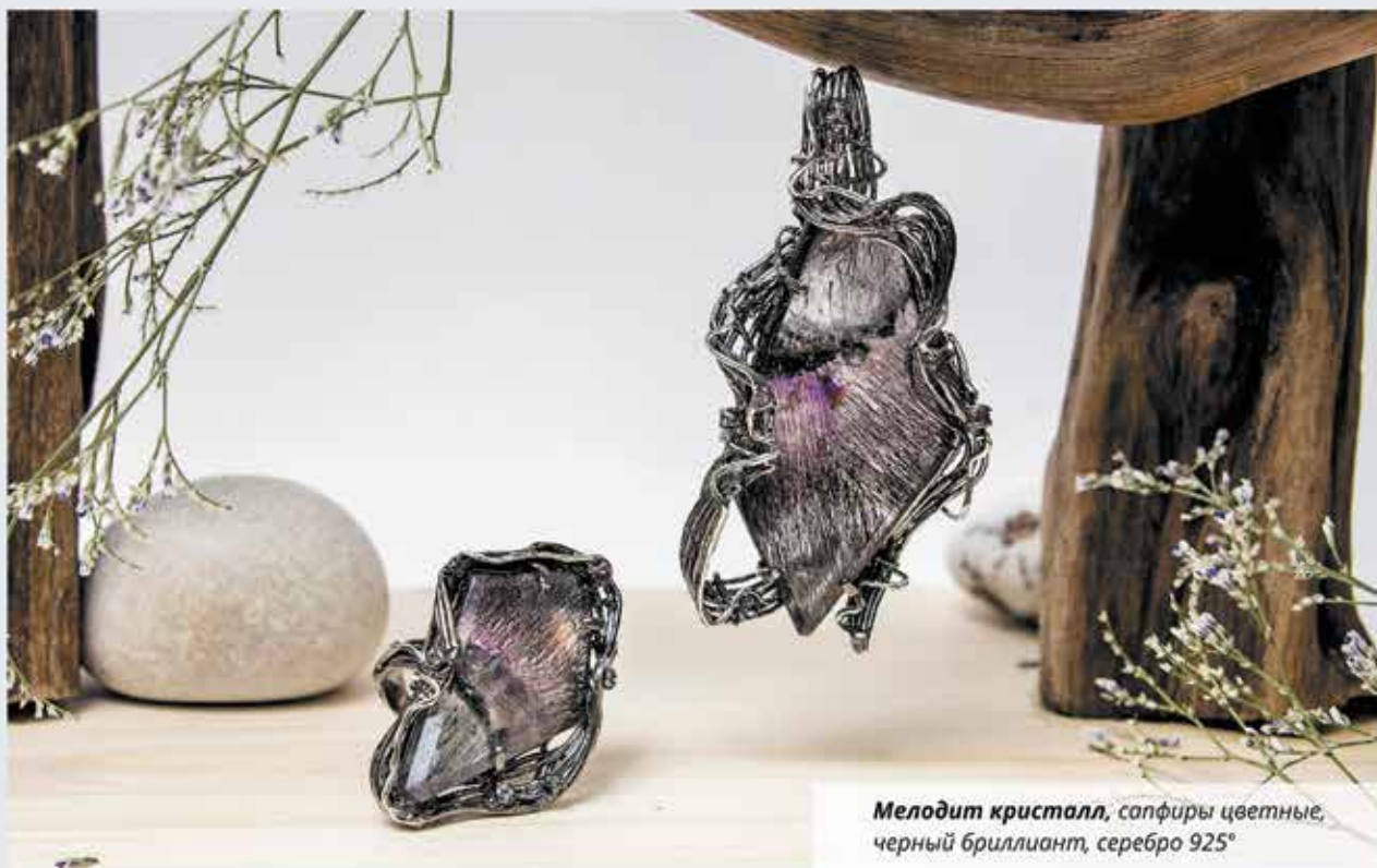
Мелодит кристалл, сапфиры цветные, черный бриллиант, серебро 925°